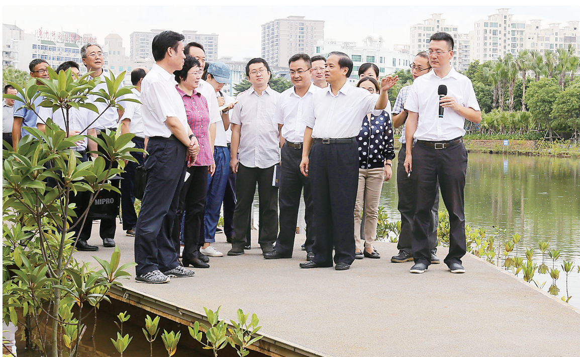
9月4日，省委书记刘赐贵来到海口美舍河国兴段，实地调研水环境综合治理和落实河长制情况。

刘赐贵强调，要深入贯彻落实习总书记关于环境治理的重要讲话精神，以切实措施落实中央大政方针和省委工作部署的最新成果。刘赐贵希望海口常抓不懈，不断巩固提高，用3到5年时间，持续推进水环境治理，形成“水清、鱼游、鸟飞”的生态链。