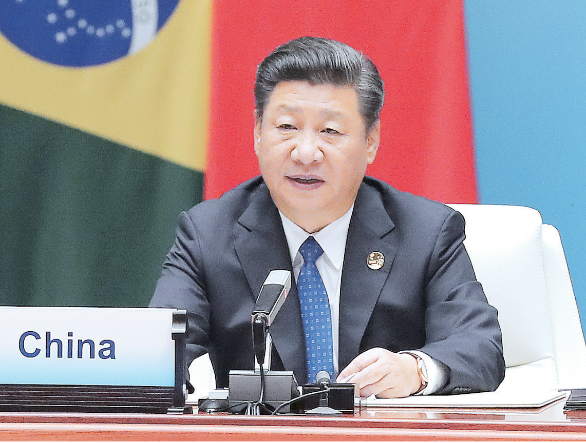
9月5日,国家主席习近平在厦门国际会议中心主持新兴市场国家与发展中国家对话会并发表重要讲话。