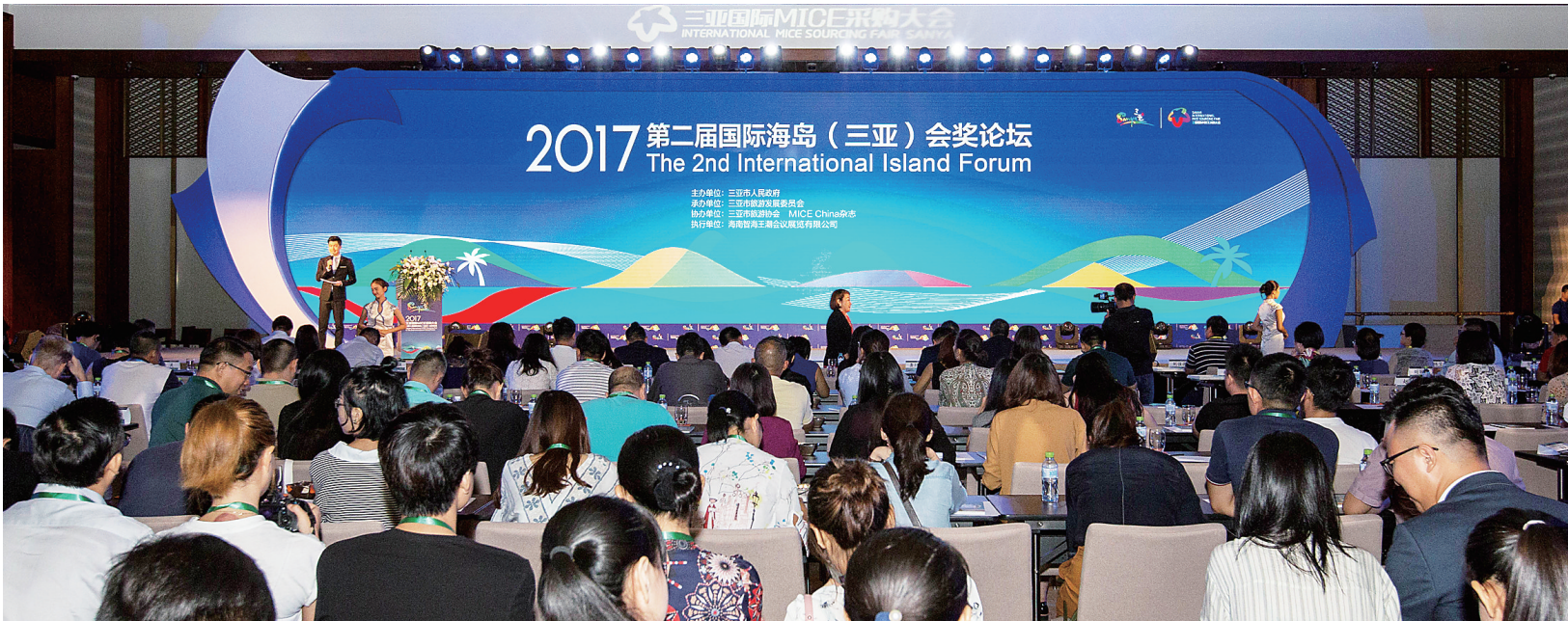
2017 第二届国际海岛(三亚)会奖论坛在三亚海棠湾举行。本报记者 武威 摄

优质会奖资源供不应求，是近年来海南会奖经济加快提升的缩影。“海南拥有完善的高档酒店设施和会展服务设施，已初步构建起以海口、三亚、博鳌、儋州为中心，其余市县特色化、差异化发展的会奖产业格局。”省旅游委国内市场与会展处调研员张晔表示，琼岛不断开发完善各类会奖旅游产品，推出的滨海度假、