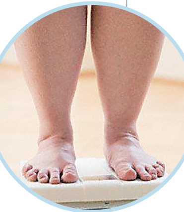
超观察卵巢是否呈多囊症状。

多囊卵巢综合征越早检查，越早治疗，效果越好。医生表示，虽然多囊卵巢综合征有许多临床症状，但科学确诊是非常重要的。除了要做不孕症常规的几项检查外，还要进行性激素六项的检测，其中有两个重要的激素水平，一个是促卵泡生成素，一个是促黄体生成素，如果两者比例关系异常，基本可以确诊为多囊卵巢综合征。此外，还可以通过彩色阴道B