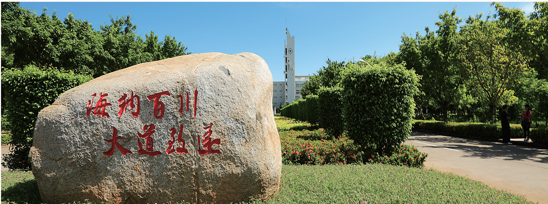
海南大学风景优美的校园。