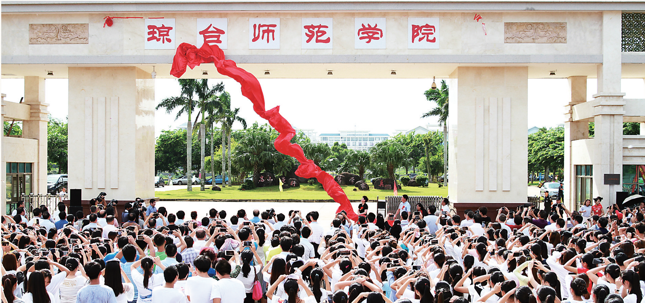
二零一六年三月二十八日,琼台师范学院挂牌成立。