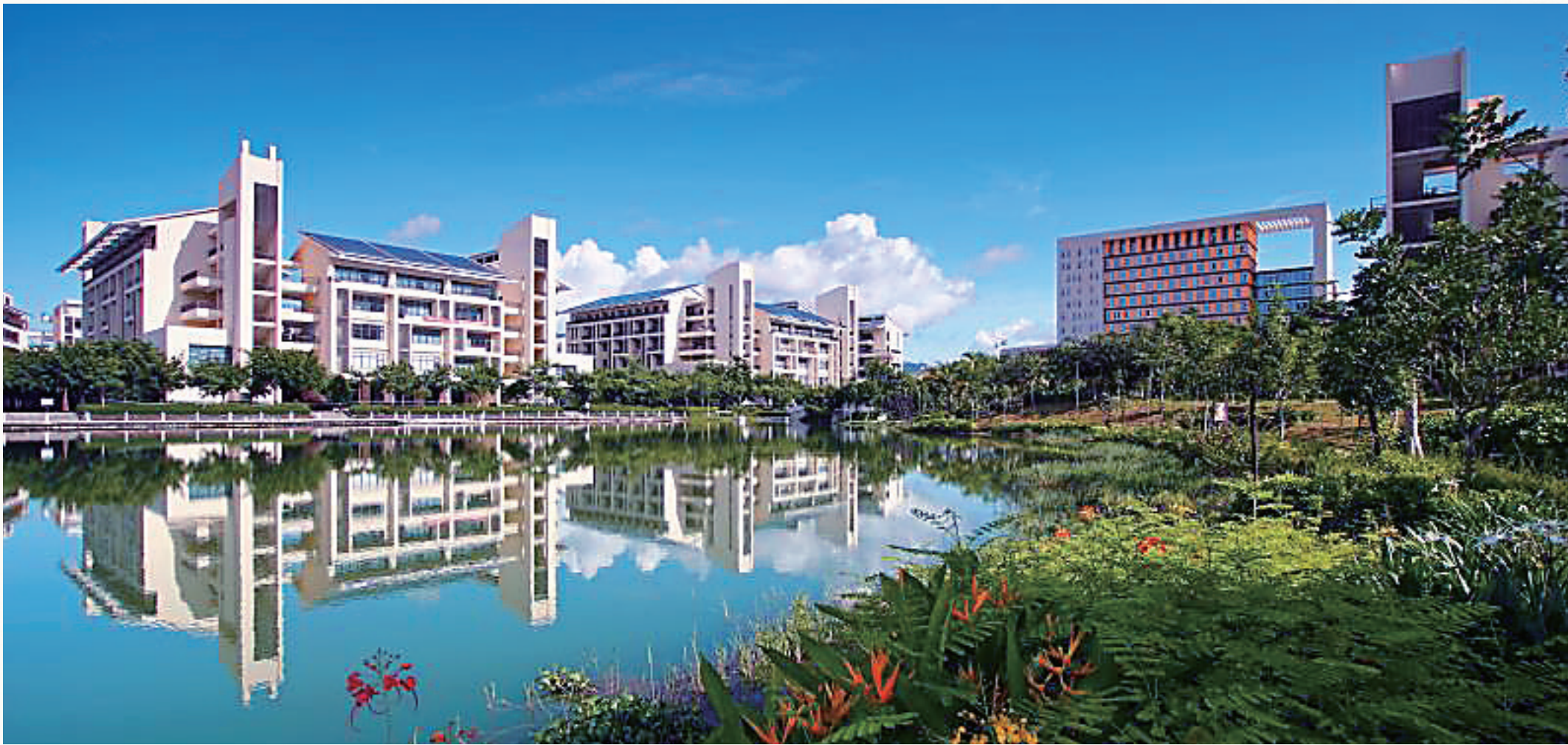
海南热带海洋学院校园风光