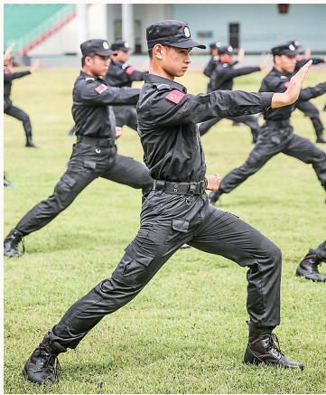
8月24日,学生在接受军事技能等训练。