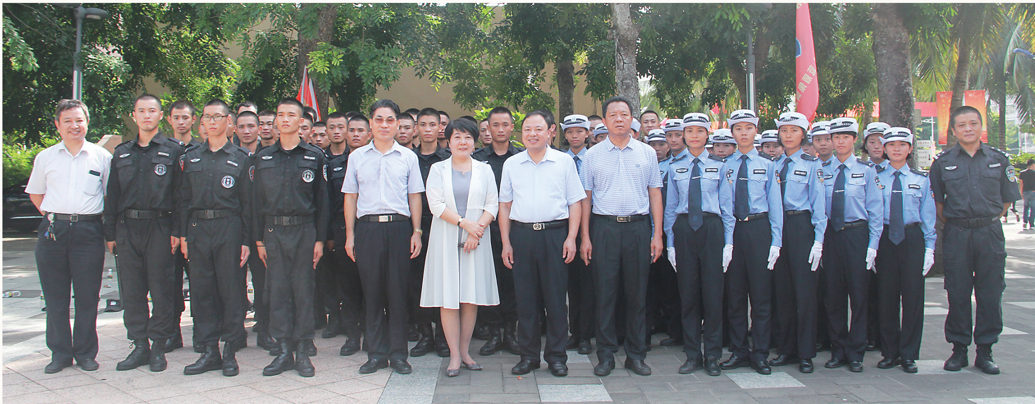
学院领导与第八届小教官合影。