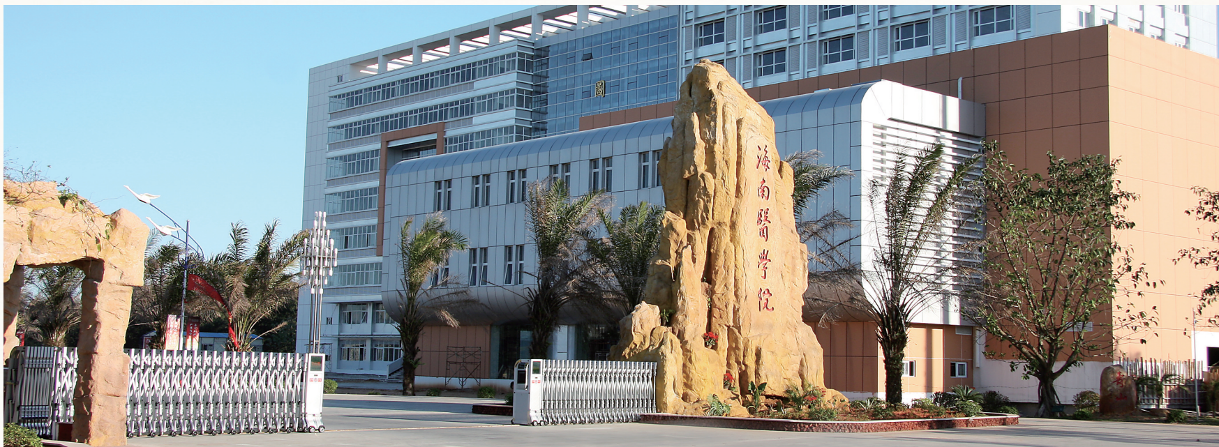
海南医学院标志性建筑——和谐门。