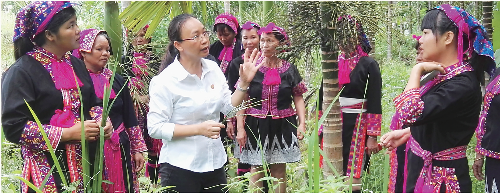
省农林科技学校老师五指山市南圣镇牙南村指导村民种植槟榔。