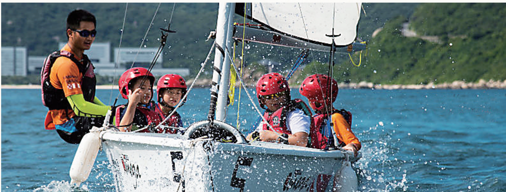
三亚市第九小学特色社团活动。