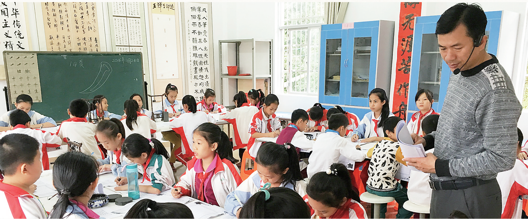
五指山毛阳中心学校的孩子们正在上书法课。