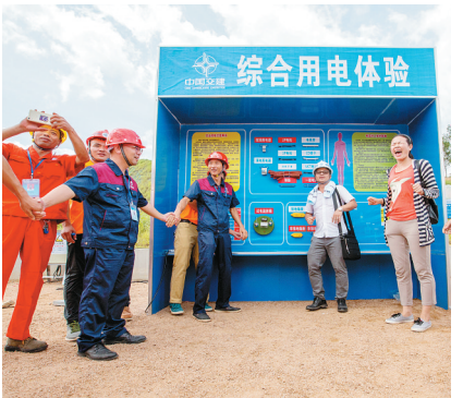
工人们在进行综合用电过电流体验。