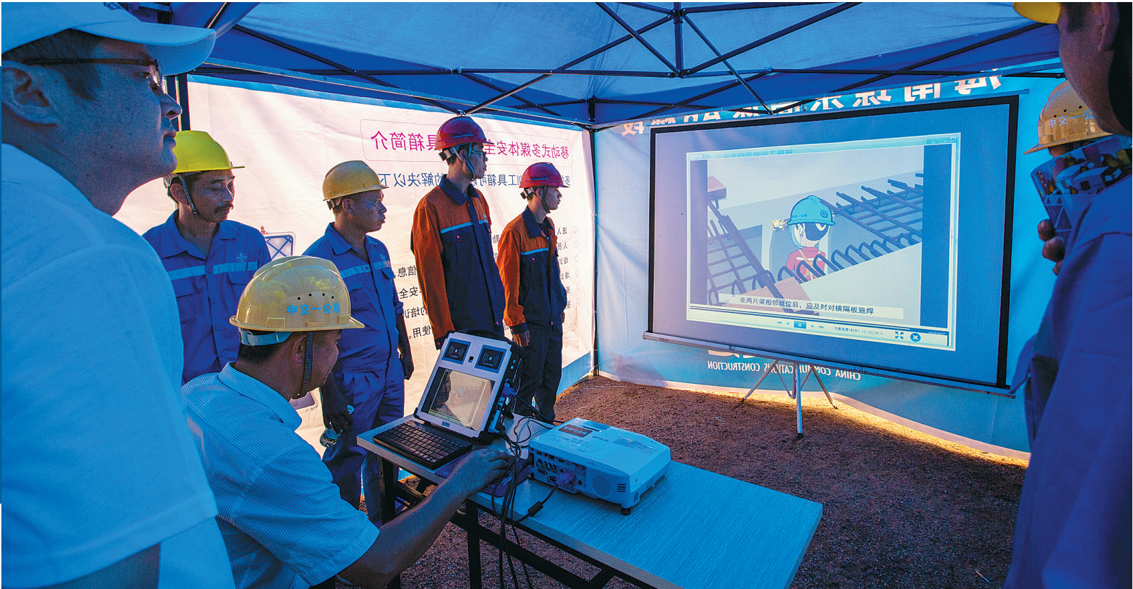
我省组织工人观看多媒体安全培训。

2017年以来，在党中央、国务院的正确领导下，在国务院安委会的指导帮助下，海南省委、省政府牢固树立以人民为中心的安全发展理念，强化工作措施，确保了全省安全生产形势总体稳定。今年1至7月，发生各类事故1823起，同比下降19.3%，死亡445人，同比下降2.6%。发生较大事故8起，同比下降11.1%，死亡24人，同比下降35.1%，没有发生重特大事故，得到了国务院安委会的充分肯定，2016年度国务院安全生产考核被评定为优秀等次。