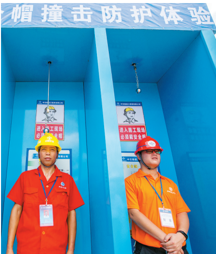
工人在进行安全帽撞击防护体验。