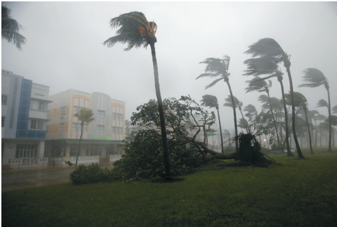
9月10日，在美国佛罗里达州迈阿密滩，树木被强风吹倒。 飓风“艾尔玛”于当地时间10日上午登陆佛罗里达群岛。