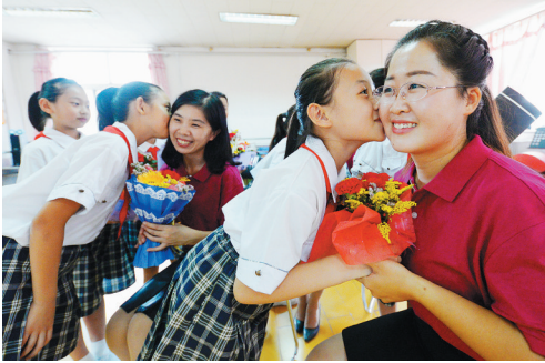
9月10日，河北省邯郸市明珠实验小学举办“巧手秀花艺 精心育桃李”主题活动，学生将手工制作的花束礼物献给老师。 当日是第33个教师节，全国各地用多种方式表达对老师的感谢和祝福。