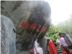
鳌驾石上的“洞天福地”。

游览东山,奇石嵯峨,壁垒古洞,曲径迂回,祥云缥缈,杂念尽抛,心旷神怡。可聆南海涛声,观海上日出。在晨钟暮鼓中,读经览史;在古径山涧中寻找神仙般的逍遥超脱;在大自然的神奇仙境中留连忘返。历代文人墨客、名宦圣贤在华封仙岩景区留下的诗词