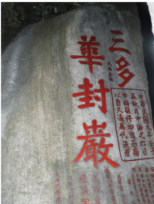
“华封岩”是海南可以辨认的最早的摩崖石刻。