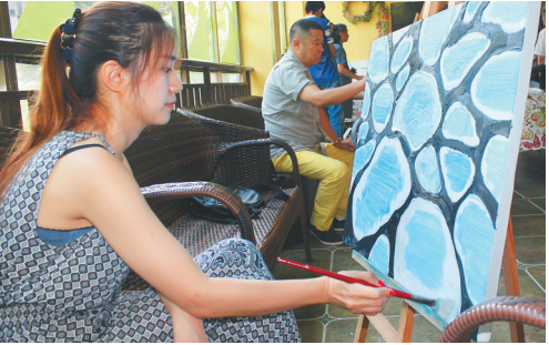
赴儋州采风的艺术家正在创作。

儋州市委常委、宣传部长温龙表示,希望以此为契机,深入开展文化交流活动,展示儋州近年来日新月异改革发展新风貌和文化建设新成果,进一步推动儋州文化繁荣发展。