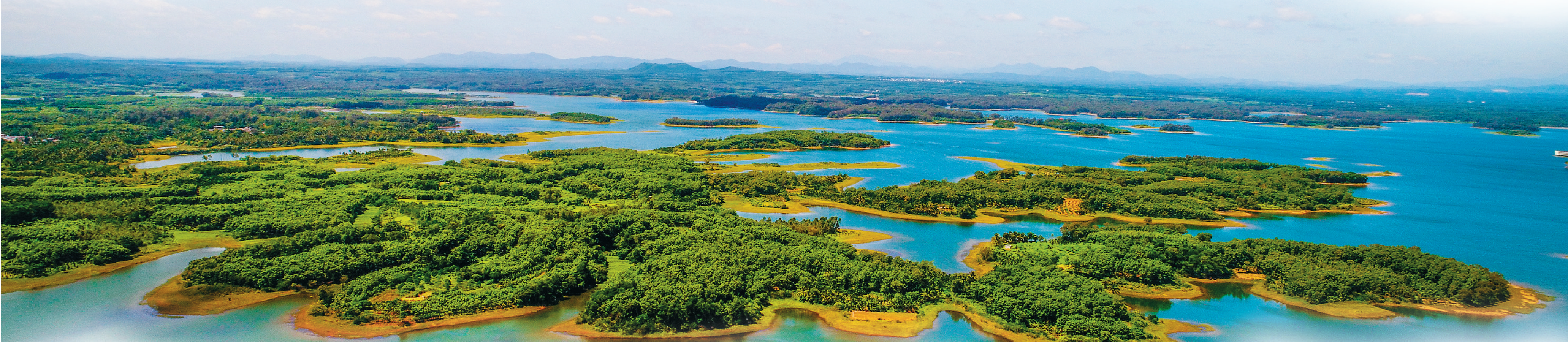
南丽湖国家湿地公园生态保护修复后美景如画。