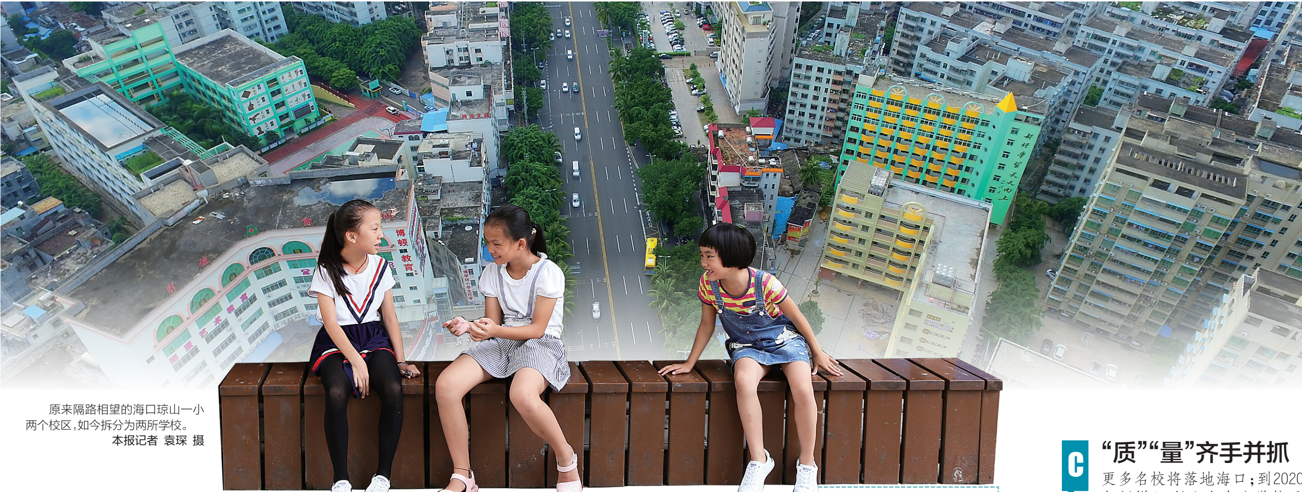
原来隔路相望的海口琼山一小两个校区，如今拆分为两所学校。