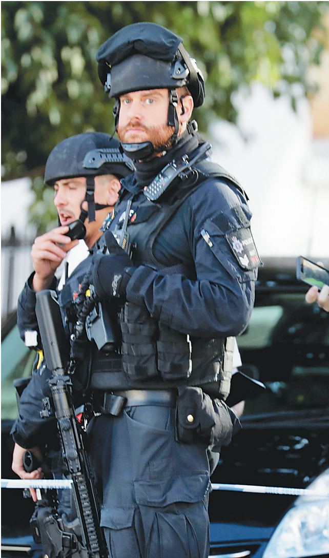
爆炸发生后，警察在伦敦一处地铁站警戒。