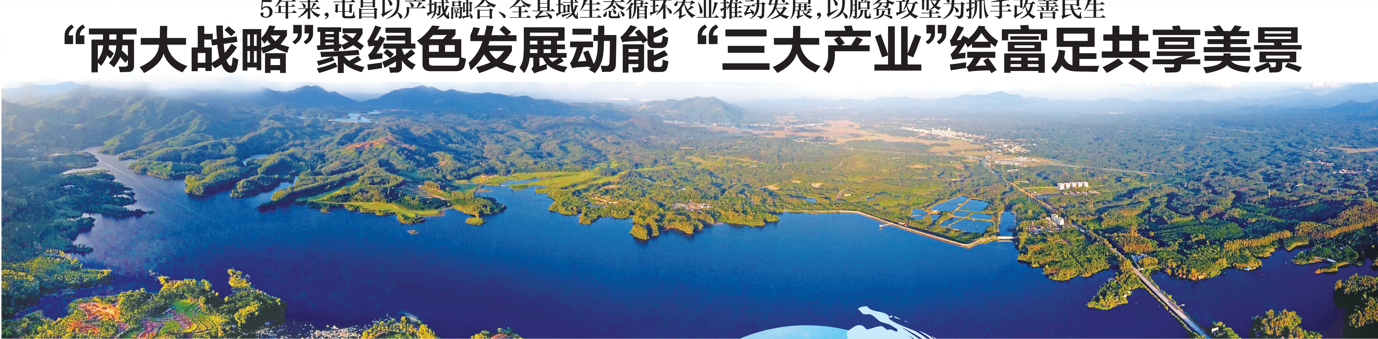
屯昌水色湖。 本报记者 陈元才 通讯员 余建军 邓积钊 摄

面对新阶段新要求，屯昌全县上下将更加紧密地团结在以习近平总书记为核心的党中央周围，全面落实党的十九大会议精神，凝心聚力，蹄疾奋进，加快建设绿色生态富足共享新屯昌，为加快建设美好新海南贡献屯昌力量，以优异的成绩迎接党的十九大胜利召开！