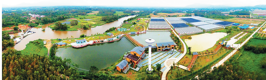
屯昌国家农业公园 | 位于屯昌县坡心镇的屯昌国家农业公园是屯昌发展生态循环农业的一个示范项目。