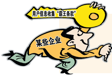
用户信息收集“霸王条款”