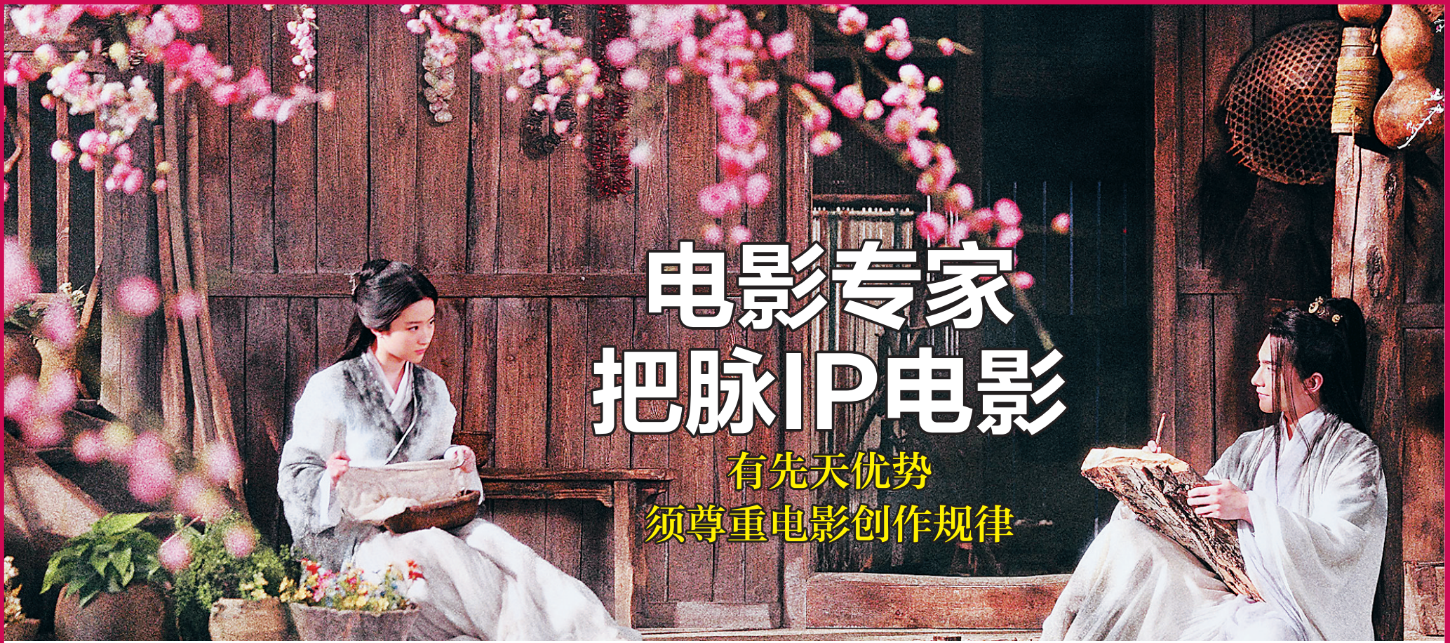
《三生三世十里桃花》剧照