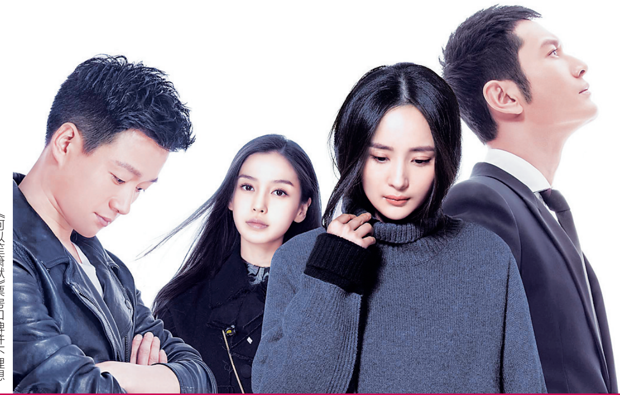
《何以笙箫默》票房口碑并不理想

近日在内蒙古自治区呼和浩特市落幕的第26届中国金鸡百花电影节上,业内专家认为,IP电影固然先天自带“粉丝”,但IP不是灵丹妙药,如果不尊重电影创作规律,IP电影也只能成为过眼云烟。