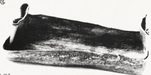
红军医院因陋就简,用椰子花蕾壳为伤员制作的洗脚盆。

据《海南省志·卫生志》记载,早在土地革命时期,琼崖红军就有了相对成型的后方医院。1931年,红军先后在各个革命根据地建立起琼崖红军医院。东路有乐万医院(后改称琼崖东路医院);西路有澄临医院(后改称琼崖西路医院);中路有东四医院(后改称琼崖中路医院)。抗战后期,琼崖独立纵队设有军医处和直属医院,军医处设有医政科、药政科、卫生科。到解放战争时期,1948年五指山革命根据地建立后,琼崖纵队总医院迁到毛贵乡坎通村,在琼纵发动的秋季攻势和春夏两季攻势作战中,为抢救伤员作出了巨大贡献。