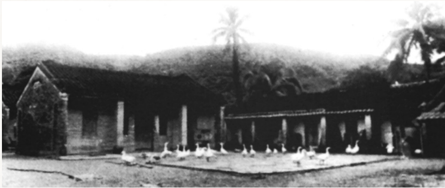
一九二八年,在革命根据地内设立了红军医院。图为乐会县第四区红军医院旧址——东兴乡岭脚村。

驱车从海榆东线由琼海一路往南直到陵水,道路西侧随处可见茂密的森林。这片广袤的土地曾是东路琼崖红军战斗的地方,也是随军转战的红军医疗队伍活动的区域。至今,东部一些地区还流传着用茄冬叶灰代替食盐,治好伤员水肿病的故事。