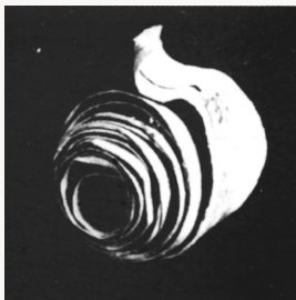
红军医务人员用香麻皮制成的绷带。

“琼纵的医疗机构为恢复和保证部队战斗力,为最终取得胜利作出了不可替代的贡献。”省委党史研究室副主任赖永生说,在那个物资极其匮乏的时代,琼纵医疗机构医生护士利用极为拮据的卫生资源,尽可能保障战士们的健康,超水平地完成了战伤伤病的救治任务。