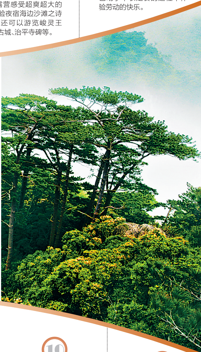
霸王岭国家森林公园。