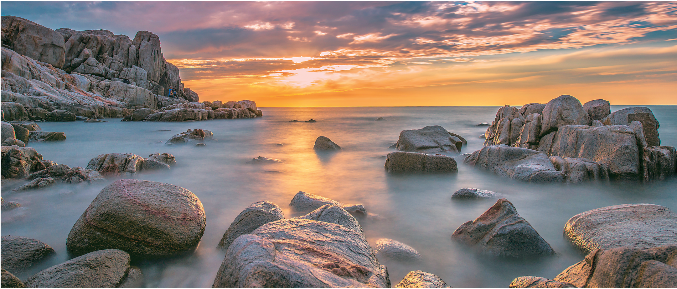
风景优美的棋子湾,是婚纱摄影、蜜月旅行的绝佳地。

“今年的‘玩海体验棋子湾’主题活动旅游活动,是昌江的三大旅游品牌活动之一,内容丰富、互动性强,欢迎省内外朋友国庆来昌江做客。”昌江县委书记黄金城说,借此次活动,昌江将充分挖掘玩海文化和霸王岭独特的热带雨林旅游资源,大力开拓旅游市场,提升“山海黎乡·纯美昌江”的影响力,着力打造主题鲜明、具有浓郁昌江特色的旅游品牌,争取早日把昌江建成海南西部首选的旅游目的地。