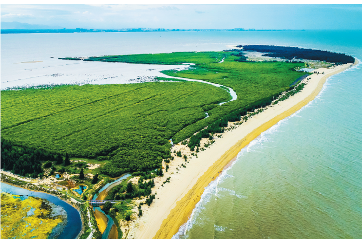
东方市八所镇鱼鳞洲灯塔。