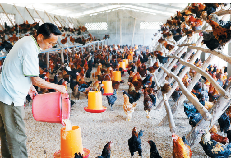
东方市江边乡实施产业扶贫，引导农户发展养蜂、养鸡、养羊、养豪猪等特色产。