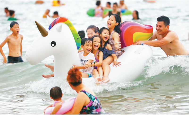
人们在三亚大东海边戏水。

“今年我们与帆船、邮轮公司合作,推出了‘帆船+邮轮+水上飞机’等12个体验项目。”荣盛美亚航空工作