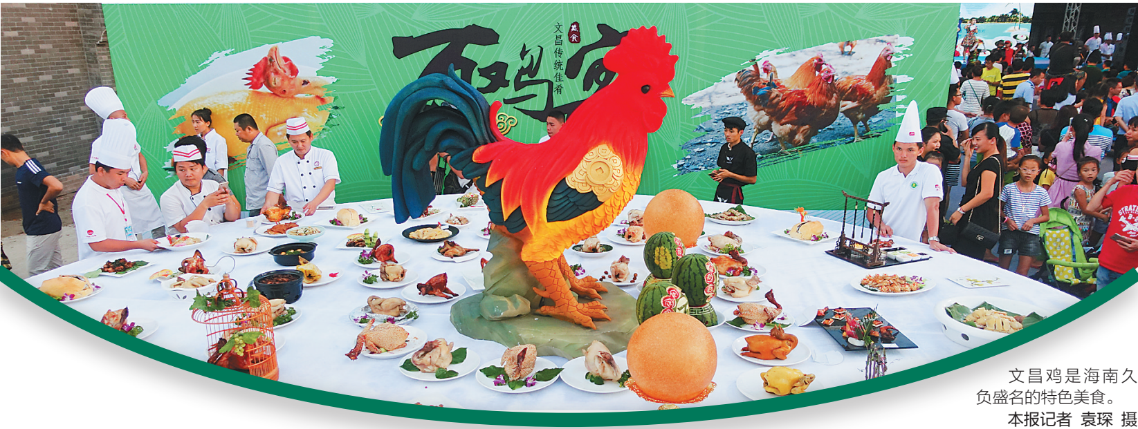
文昌鸡是海南久负盛名的特色美食。

民以食为天。在“吃、住、行、游、购、娱”旅游六要素中,排在第一位的就是“吃”,很多人甚至认为,吃得好,就是一次好的旅行。但在传统旅游产业发展中,人们关注更多的还是住、行、游等旅游“刚需”,吃往往被选择性遗忘。其实,在旅游已经成为人们刚需的全域旅游时代,吃得好不好、开不开心,已经成为人们评判一次旅行的重要指标。