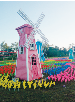
风车阵。 文/洪宝光 本版策划/洪宝光

若你想来一场安静惬意、休闲放松的旅行,定安是最佳选择! 这里有触手可及的阳光、轻轻掠过的微风、干净清新的空气、纯美湛蓝的天空,再加上沿路美不胜收的田园风光、火山地貌、山地景观、民俗特色,包你流连忘返。更难得的是,今年国庆期间,2017首届海南定安泥人节、“传承耕读文化品尝生态美食”自然学堂等活动将陆续在定安上演。跟着我们一起,玩转不一样的定安吧!