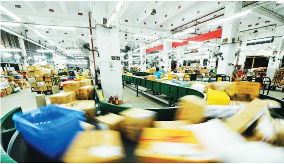
优化后的邮件处理设备为全岛邮件提速提供了强力支撑。

近年来,海南邮政积极参与美好新海南建设,主动对接海南做强热带高效农产品销售的需求,构建了“购物不出村、销售不出村、金融不出村、生活不出村、创业不出村”的“五不出村”邮政农村电商生态体系,为农村地区提供有特色的邮政电商精准扶贫服务,履行扶农富民的社会责任。在线下,建成了由19个市县物流配送中心、380个邮政支局、2976家邮政综合便民服务站、1958家“邮乐购”店和2610个村邮站组成的覆盖全省的农村电子商务服务网络体系,为农村地区提供“最初一公里”和“最后一公里”实物收寄和配送服务。在