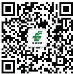
扫码关注海南邮政公众服务号。