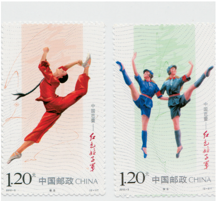
中国邮政发行的《中国芭蕾——红色娘子军》系列邮票。

在线下,除了设立文昌航天邮局,还设立了天涯海角爱情邮局、昌江木棉花邮局、长乐公主游轮主题邮局等7个主题邮局。在线上,依托中国集邮网上营业厅开设了海南集邮网上营业厅,在微信“海南邮政服务号”设置了集邮微商城,许多省外的集邮爱好者,通过线上平台下单,很便捷地购买到了海南题材的邮品,海南之美,越传越远。