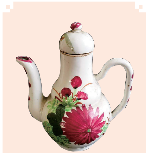
福建地方窑民国粉彩梨形壶