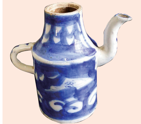
青花云龙纹清末民初小江瓷