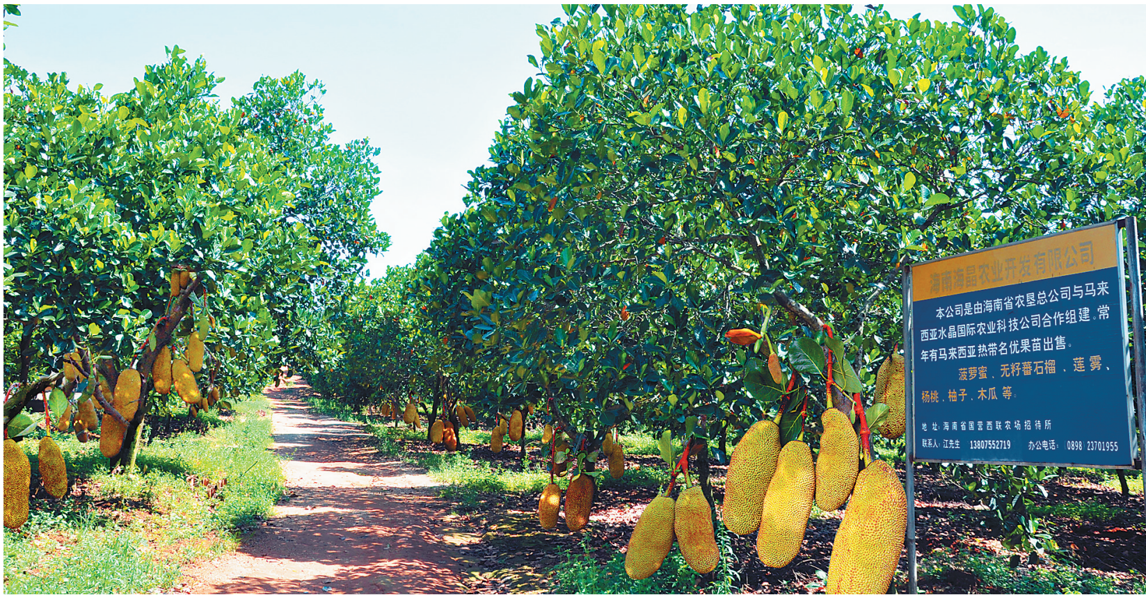
海晶菠萝蜜产业基地。

海晶菠萝蜜的地理位置： 海晶菠萝蜜是农垦西联农场公司重要的特色农产品，该农场公司交通便利，位于海南西部的儋州市市郊，距西线高速入口处22公里，距海口130公里。