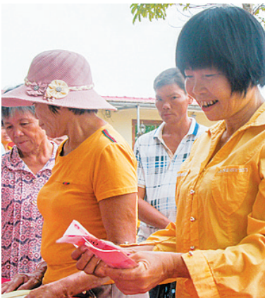
健丰养殖专业合作社分红现场。