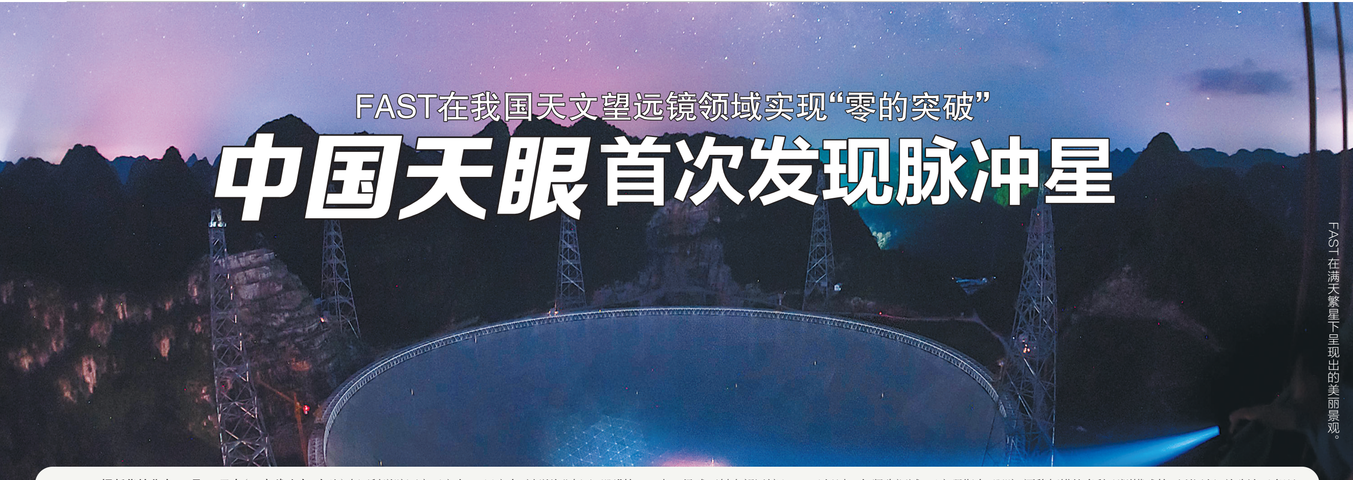
FAST在满天星斗呈现出的美丽景观。

据新华社北京10月10日电(记者董瑞丰、齐健)中国科学院国家天文台10日宣布,被誉为“中国天眼”的500米口径球面射电望远镜(FAST)经过一年紧张调试,已实现指向、跟踪、漂移扫描等多种观测模式的顺利运行,并确认了多颗新发现脉冲星。这是我国天文望远镜首次发现脉冲星,在该领域实现了“零的突破”。 此次发布会上公布了2颗脉冲星的具体信息,编号分别为J1859-0131和J1931-01。前者自转周期为1.83秒,距离地球约1.6万光年;后者自转周期为0.59秒,距离地球约4100光年。2颗脉冲星分别由FAST于今年8月22日、25日在南天银道面通过漂移扫描发现。FAST工程副总工程师李的介绍,FAST调试进展超过预期,并已开始系统的科学产出。目前已经探测到数十个优质脉冲星候选体,其中6颗通过国际认证。未来,FAST有望发现更多守时精准的毫秒脉冲星,对脉冲星计时阵探测引力波做出原创贡献。