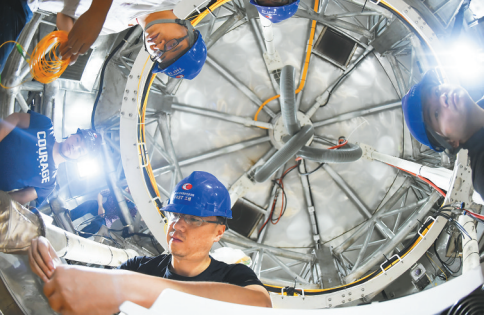
工作人员在FAST馈源舱内工作。