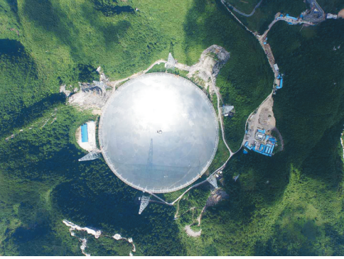
航拍落成启用的“天眼”。