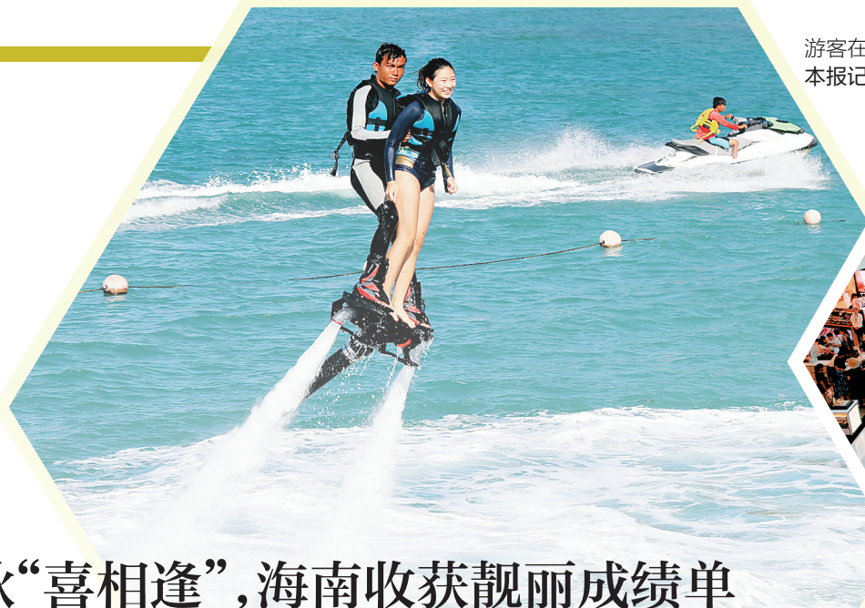
游客在景区体验“水上飞龙”项目。

今年国庆、中秋喜相逢凑成8天假期,让十一黄金周升级为“超级黄金周”,无论是旅游市场还是消费市场,都迎来了数据高峰期。 海南在今年的“超级黄金周”里收获了漂亮成绩单:10月1日至8日,全省共接待游客410.30万人次,同比增长17.1%;旅游总收入80.91亿元,同比增长58.5%。记者注意到,今年国庆中秋假期我省旅游市场呈现出了主题分明的特点,自驾游、乡村旅游持续火热,美食游、购物游人气火爆,各类民宿颇受追捧,展现出日渐个性化的旅游消费需求,“到另一座城市体验另一种生活”使得人们从单纯“旅游”升级到体验“度假”。