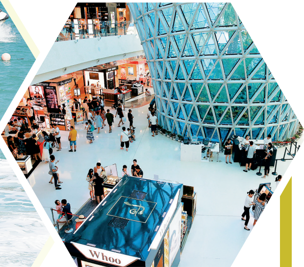
长假期间,游客在三亚国际免税城选购。