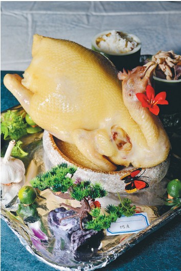
文昌十大美食之农家腌鸡。

2016年前，谈到文昌，首先想起的往往是文昌鸡、孔庙、侨乡。 2016年，长征七号运载火箭在文昌航天发射场腾空而起，成功升天。此后，文昌又有了一个响当当的名字：航天之城。好风凭借力，文昌以火箭升空的速度，让世人瞩目，闻名中外。素以敢闯敢干著称的侨乡人，紧抓机遇，吸引了一大批企业来到文昌考察交流，投资兴业，让文昌的经济发展迈向了新台阶。