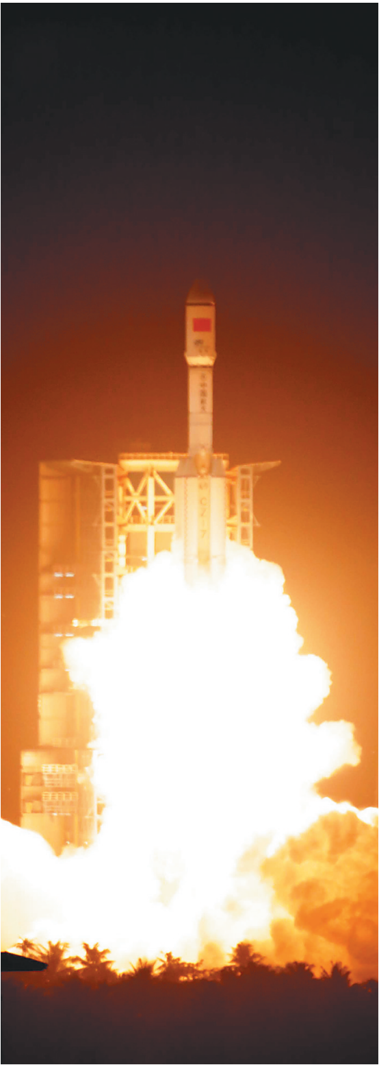
2016年6月25日晚，我国新一代运载火箭长征七号在文昌航天发射场成功发射。