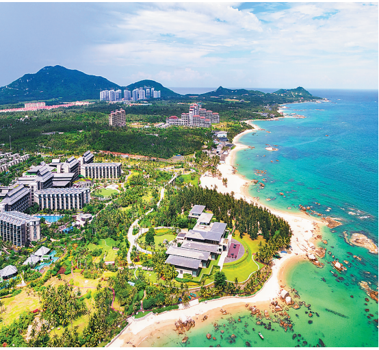
休闲度假在淇水湾。