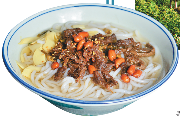
文昌十大美食之抱罗粉。