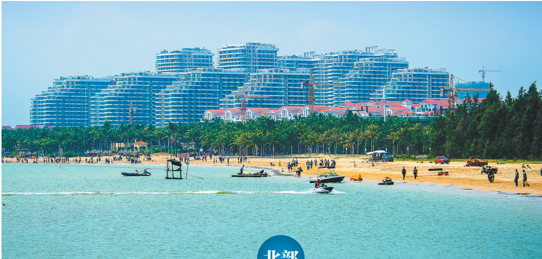
宜居新城高隆湾。

●十八行村 中国文化历史名村 在十八行村，你不用惊讶，你看到的就是500年前海南古名居的原始模样，成功入选中国文化历史名村。