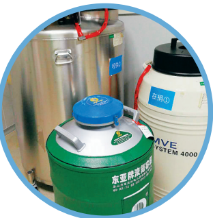
海南省人类精子库存储精子的液氮罐。

哪些人适合进行精子存储服务?通过“精子银行”的精子生出来的宝宝是否健康?带着这些人们普遍关心的疑问,记者近日走进海南省人类精子库采访了有关专家。