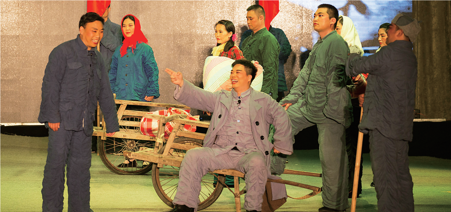
10月12日晚,大型话剧《红旗渠》在陵水黎族自治县上演。