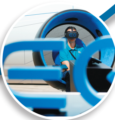
梅赛德斯—奔驰公司EQ概念车。