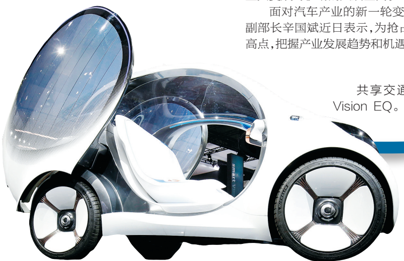
共享交通概念车 Smart Vision EQ。