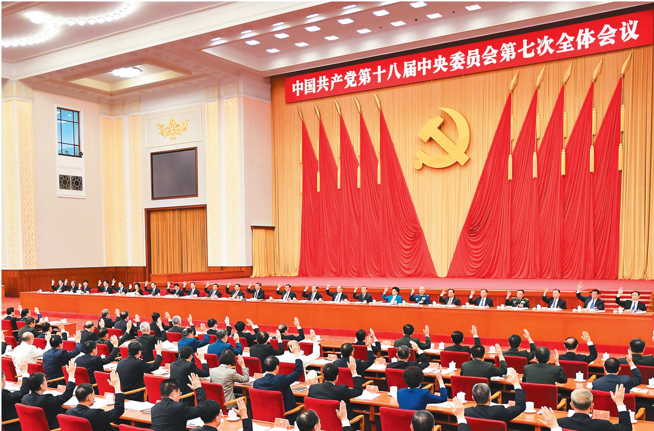
中国共产党第十八届中央委员会第七次全体会议,于2017年10月11日至14日在北京举行。中央政治局主持会议。

新华社北京10月14日电 中国共产党第十八届中央委员会第七次全体会议公报 (2017年10月14日中国共产党第十八届中央委员会第七次全体会议通过) 中国共产党第十八届中央委员会第七次全体会议,于2017年10月11日至14日在北京举行。出席全会的有中央委员191人,候补中央委员141人。中央纪律检查委员会委员和有关负责同志列席会议。 全会由中央政治局主持。中央委员会总书记习近平作了重要讲话。 全会决定,中国共产党第十九次全国代表大会于2017年10月18日在北京召开。 全会听取和讨论了习近平受中央政治局委托作的工作报告。会议讨论并通过了党的十八届中央委员会向中国共产党第十九次全国代表大会的报告,讨论并通过了党的十八届中央纪律检查委员会向中国共产党第十九次全国代表大会的工作报告,讨论并通过了《中国共产党章程(修正案)》,决定将这3份文件提请中国共产党第十九次全国代表大会审查和审议。习近平就党的十八届中央委员会向中国共产党第十九次全国代表大会的报告讨论稿向全会作了说明,刘云山就《中国共产党章程(修正案)》讨论稿向全会作了说明。 全会充分肯定党的十八届六中全会以来中央