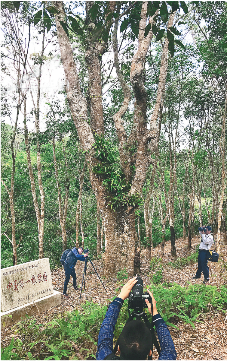
琼安胶园的百年橡胶树吸引游客前来观光。

本报海口10月16日讯(海南农垦报记者张佳琪)10月13日,由中华全国总工会组织的2017年首批全国劳模疗休养活动在海垦神泉集团(南田农场)圆满落幕。据悉,来自黑龙江、四川、甘肃、陕西、福建5个省份的200多名全国劳模代表参加了此次为期7天的疗休养活动。期间,活动组织了丰富多样的学习交流环节。劳模代表先后聆听专家学者的专题讲课;在海南六连岭烈士陵园敬献花圈;走进南田职工果园,深入了解神泉集团的改革历程。来自四川省的全国劳模潘成英激动地说,在神泉集团实地感受到了企业发展和职工生活欣欣向荣的景象,这对于劳模代表是一种激励和鞭策,增进了劳模代表在本职岗位干事创业的激情。全国劳模、海垦神泉集团、海垦果业集团董事长彭隆荣说,希望与广大全国劳模一样,再接再厉,在各自的岗位上为国家和社会作出应有的贡献。据悉,全国总工会于2014年制订并实施《劳模休养五年规划(2014—2018)》,根据计划安排,全国总工会拟在5年内,组织4.7万名劳模参加休养。作为全国总工会的劳模疗休养基地之一,神泉集团每年平均接待全国各级劳模疗休养活动两个批次,最高达到一年6个批次,接待劳模代表人数达2000多人次。