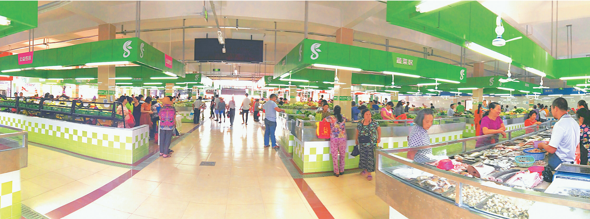
新一轮农垦改革开展后,原立才农场社会职能移交地方,三亚市政府加大民生投入改善当地基础设施。图为经过升级改造后的立才农贸市场面貌焕然一新。