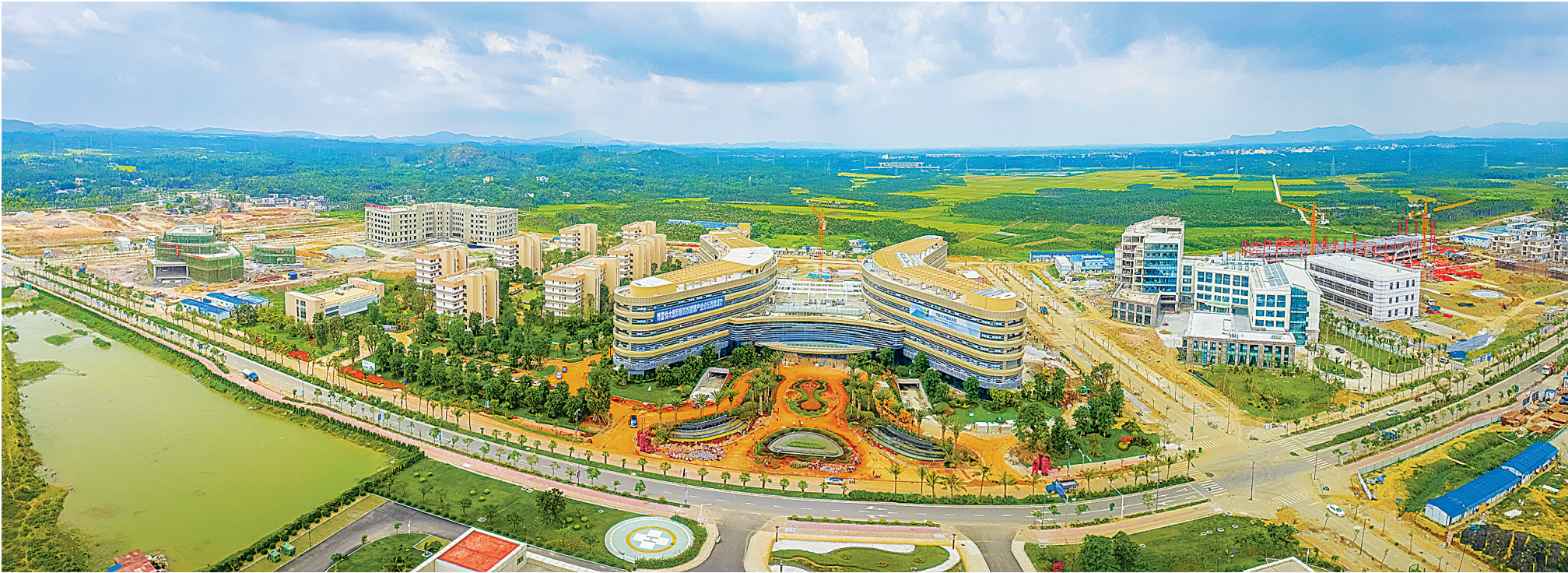
琼海博鳌乐城国际医疗旅游先行区。