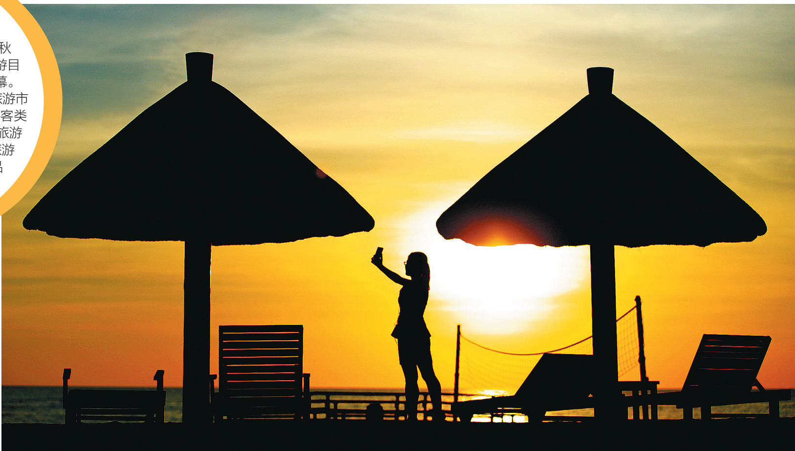
龙沐湾落日美景。本报记者 张茂 摄