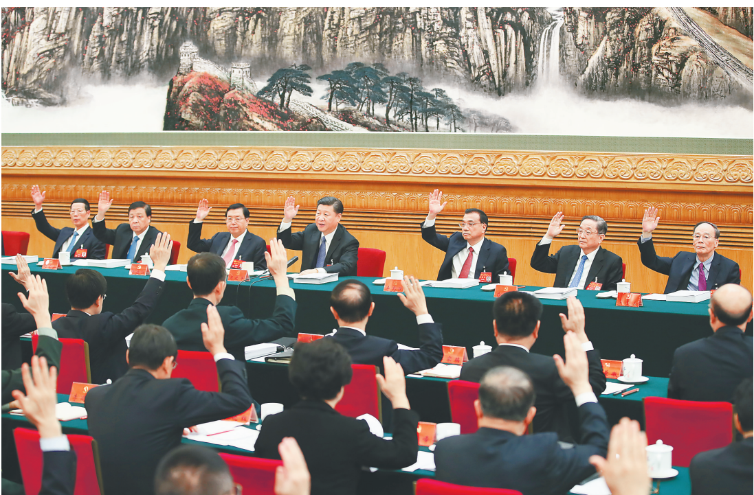
10月23日，中国共产党第十九次全国代表大会主席团在北京人民大会堂举行第四次会议。习近平、李克强、张德江、俞正声、刘云山、王岐山、张高丽等出席会议。

新华社北京10月23日电 中国共产党第十九次全国代表大会主席团22日晚和23日上午在人民大会堂举行第三次和第四次会，通过十九届中央委员会委员、候补委员和中央纪律检查委员会委员候选人名单(草案)，提交各代表团酝酿。