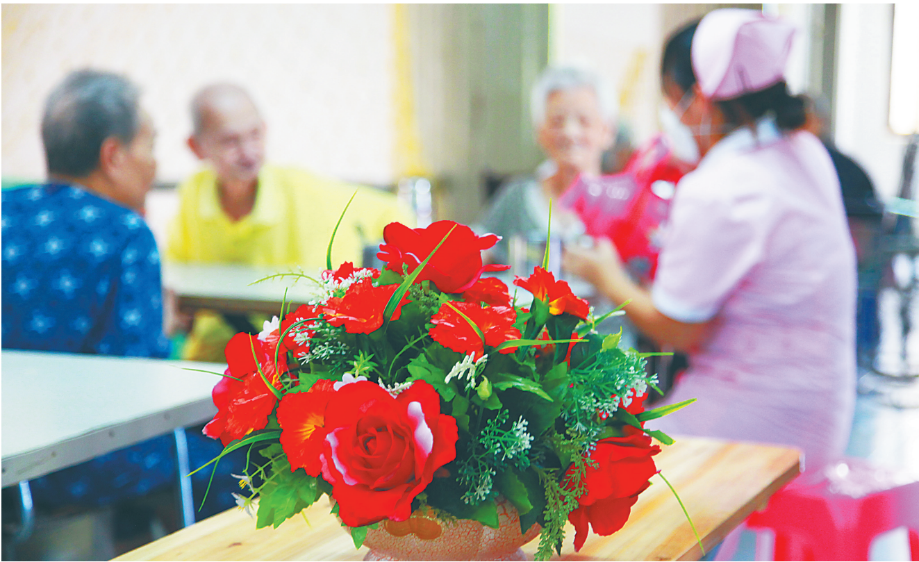
在椰岛之家老年公寓里,医护人员在照顾老人。

来。崭新的房间内设施齐备,院内绿草如茵,特因供养老人们正围坐在一起吃饭聊天,他们对自己居住的环境和管理人员的饮食生活照料非常满意。