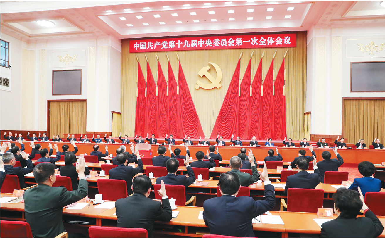
左图:10月25日,中国共产党第十九届中央委员会第一次全体会议在北京人民大会堂举行。习近平同志主持会议并作重要讲话。