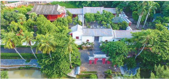
俯瞰修缮后的五公祠景区。

琼山知县杨秉宸发动乡人对文峰塔进行一次大修，并扩大了文峰塔的建筑规模，在塔的周边重建了文昌祠、观音阁等设施。而后文峰塔又多次被吹倒，多次重修。