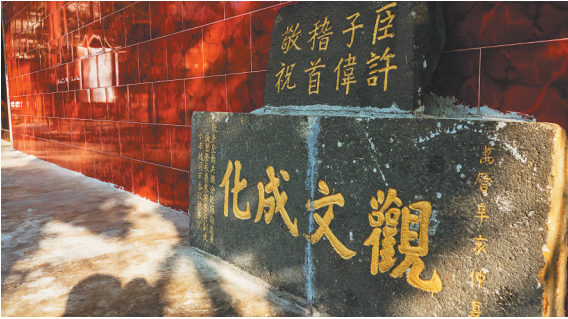
美舍河畔大悲阁仅存的两块碑刻。