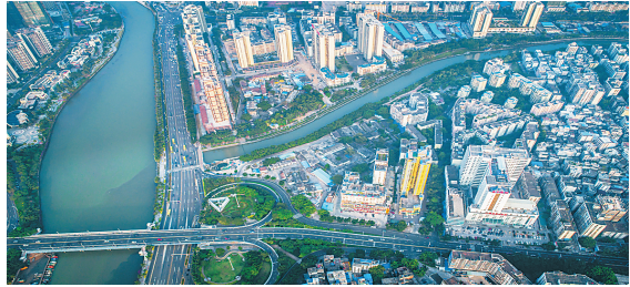
美舍河经长堤路注入海口溪。