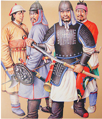
元朝崇尚武力,疆域广阔。

朱国宝到海南后,采用恩威并施的方式,在很短时间内就安定了琼崖。据《元史·朱国宝传》记载,朱国宝“移琼州,立官程,更弊政,训兵息民,具有条制”。他在琼州上任后,首先