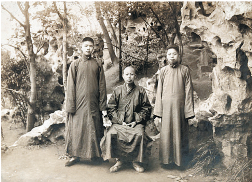
1918 年 8 月，李叔同（中）与丰子恺（右）合影。