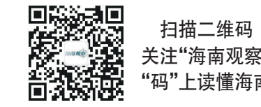
扫描二维码 关注“海南观察” “码”上读懂海南

务,实事求是地为相关受困扰的用户变更用电性质,更正相关问题,并退回多收的水电费。如此,问题的解决便要简单得多了。 无论是公共服务还是政务服务,只有主动作为再进一步,让服务“多跑一程”,才能让百姓少跑腿,才能让民心更舒畅。一些工作中,难免会遇到各种问题,但相关部门、企业不能逃避,而是要从更高的站位看待问题,要本着实事求是的精神、马上就办的态度予以解决,有错即改、举一反三,从宏观层面、更广范围解决问题,真正做服务百姓的贴心人。