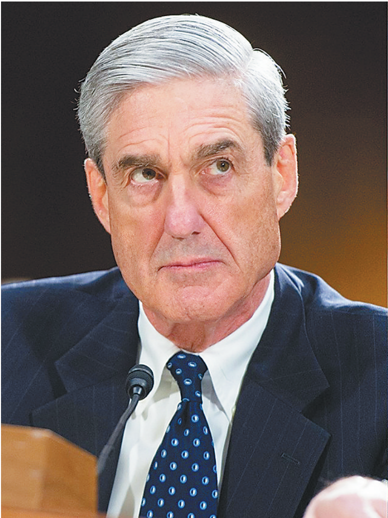
在“通俄门”听证会上的美国司法部特别检察官罗伯特·米勒。

美国总统唐纳德·特朗普的3名前竞选团队成员10月30日受到起诉，成为美国司法部特别检察官罗伯特·米勒主持“通俄门”调查以来提起的首批诉讼。 白宫回应道，这些案件中没有任何证据显示特朗普“通俄”。