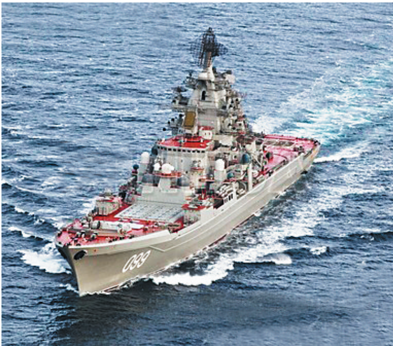
近日，俄重型核动力导弹巡洋舰“彼得大帝”号通过挪威海峡。

被誉为“航母杀手”，将在2017年内完成量产。如果“纳希莫夫海军上将”号能携带160枚“锆石”导弹，单舰即可对美国海军航母打击群发起饱和攻击。如果“纳希莫夫海军上将”号换装“锆石”和“口径—NK”巡航导弹，再加上近300枚各型舰空导弹、20枚以上反潜导弹，该舰将成为一个全新“武库舰”，具备强大的反舰、防空、对陆攻击和反潜作战能力。 建造的一些大型军舰，如“库兹涅佐夫”号航母、“基洛夫”级巡洋舰、“光荣”级巡洋舰等进行现代化改装，以期它们在未来较长时间内成为海军主力，彰显俄在国际政治上的影响力，维持俄罗斯的大国地位。 （据新华社北京10月31日电 记者 刘莉莉 赵嫣）