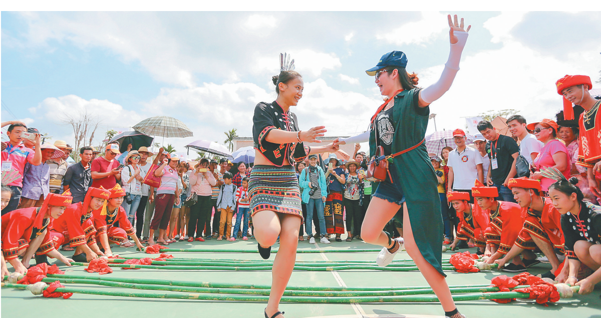
今年的欢乐节将有彰显本土特色文化的竹竿舞邀请赛。

团，组委会还计划邀请贵州、云南等国内代表队以及缅甸、老挝、越南等国外代表队携其优秀的舞团前来切磋技艺，打造一场高水平的国际性竹竿舞大赛。届时，参赛队伍将身着极具地域特色的民族服饰，将“平步跳”“手牵手跳”“筛米跳”等各类高难度经典舞蹈动作一一还原，令人期待。11月19日，本届海南国际竹竿舞邀请赛将在海南国际会展中心举行总决赛，为百姓、游客呈