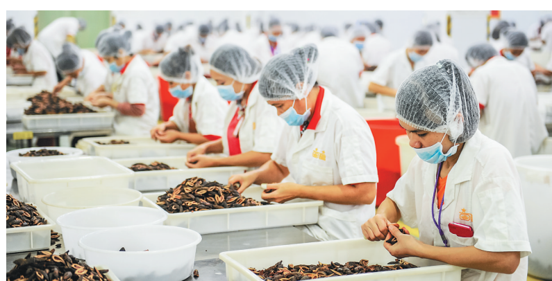
在万宁,越来越多的槟榔加工企业采用槟榔烘干环保设备。

林基表示,对绿色环保烘干设备推广的产品,万宁市均进行补贴。目前,万宁已累计投入7838.38万元,推广槟榔烘干环保设备5392台,年加工槟榔鲜果约40万吨,完全能够满足当地槟榔加工的需求。