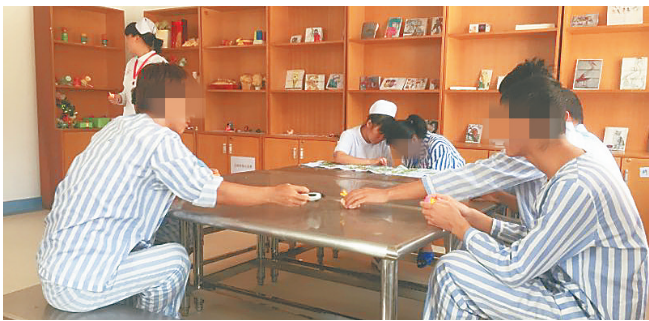
患者在医护人员指导下干手工活。

2012年以来，在对精神病患者的康复上，平山医院秉承“症而不病，病而不残，残而不障”的原则，以“全员全过程康复治疗”的重要思想为指导，设立康复部，成立康复训练中心和康复农场，彻底打破过去精神病患者“集体关锁”传统管理模式，对病人实行“分区、分类、分级”管理，施以人文关怀，倡导全部、全员、全过程精神康复，让精神病患者参与室内和户外的康复治疗，通过家居、劳作、娱乐等基本生活技能的训练，给精神病患